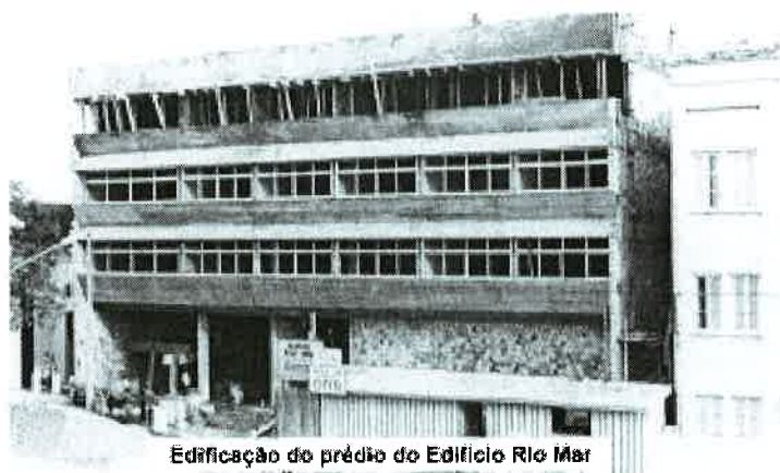
Edificação do prédio do Edifício Rio Mar

Em 1967, com recursos do Banco da Amazônia S.A., foram iniciadas as obras do atual Edifício Rio Mar, localizado na Rua José Clemente, 500, ao lado do Teatro Amazonas, para onde finalmente, foram transferidos os estúdios e a administração da emissora.